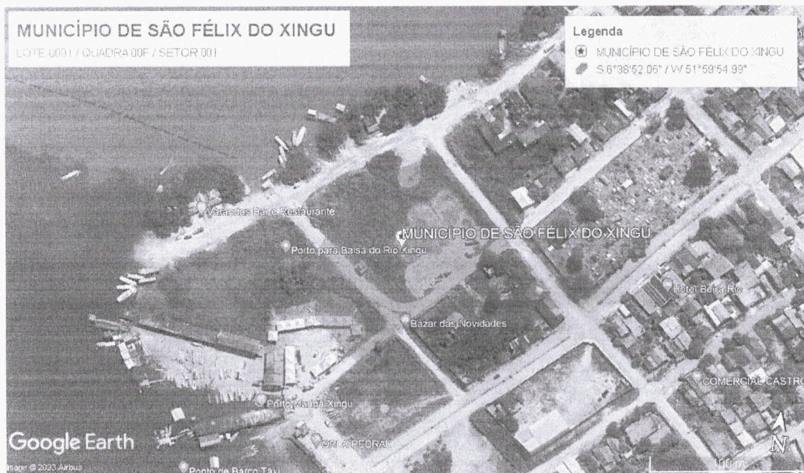
Figura 2 - Mapa de Localização